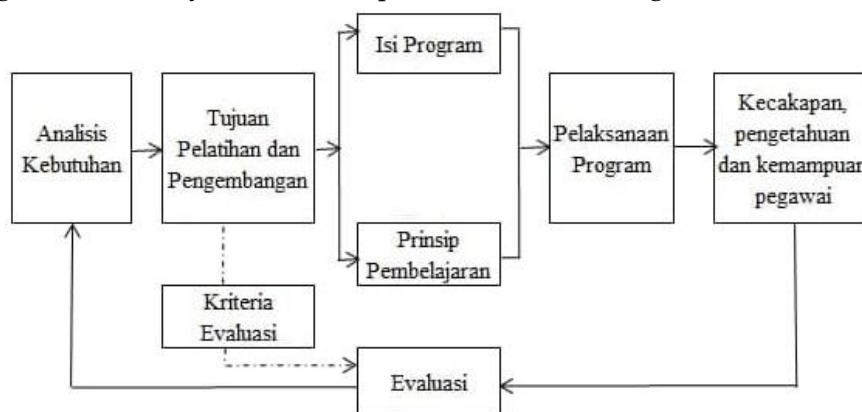
Gambar 1.2 Pengembangan Sumber Daya Manusia

Tahapan evaluasi ( controlling ) dilakukan setelah proses kerja dilakukan. Pada proses ini, kinerja dinilai apakah sesuai dengan planning . Pada tahap ini manajemen mengevaluasi keberhasilan dan efektifitas kinerja, melakukan klarifikasi dan koreksi, dan juga memberikan alternatif solusi masalah yang terjadi selama proses kerja berlangsung. 2 Evaluasi yayasan terhadap kegiatan madrasah sudah dilakukan sekali dalam satu semester. Dari hasil evaluasi diketahui bahwa guru dan karyawan memiliki potensi yang bagus dalam keterlibatannya ditengah masyarakat. Namun tidak dapat dipungkiri hasil evaluasi menunjukkan rendahnya kompetensi profesional guru. Masih terdapat guru yang belum memahami teknologi informasi, kurang kreatif dalam menyampaikan pembelajaran. Hal tersebut terjadi karena masih terdapat guru yang kualifikasi pendidikannya belum sesuai standar. Kemudian guru juga tidak memperoleh pengembangan dan pelatihan secara rutin. Berikutnya proses pengembangan sumber daya manusia dapat terlihat dalam bagan berikut ini: